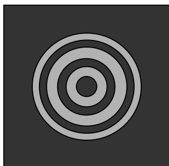
Figure 3. Aspect d'une étoile avec une bonne collimation.

A ce stade, la collimation de votre télescope ne sera probablement pas bonne (Figure 2). Ajustez maintenant les vis appropriées jusqu'à ce que les miroirs et leurs réflexions soient à nouveau concentriques (Figure 1), et que le miroir secondaire soit maintenu en toute sécurité. Si une vis devient plus dure au serrage, relâchez plutôt la vis opposée. Consultez également le manuel d'utilisation de votre télescope. Il contient certainement des instructions complémentaires.