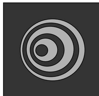
Figure 4. Aspect d'une étoile avec une mauvaise collimation.