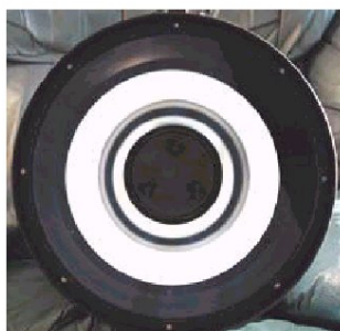
Figura 1: Aspetto degli specchi collimati

4. Se il seeing è molto buono, come test finale di collimazione, se volete proprio essere raffinati, esaminate un'immagine stellare a fuoco con un oculare ad altissimo ingrandimento (circa 350x per un 20 cm, 450x per un 25). Il punto luminoso dovrebbe avere l'aspetto di un piccolo disco centrale (chiamato "disco di Airy") circondato da uno o più anelli di diffrazione. Se necessario, regolate ancora le 3 viti di collimazione (saranno rotazioni quasi impercettibili), per centrare il disco di Airy rispetto all'anello di diffrazione (sempre mantenendo la stella al centro del campo). Effettuato questa regolazione finale, il vostro telescopio è collimato alla perfezione, ed offre il meglio che la sua ottica consente.