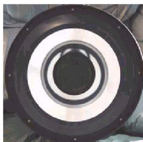
Figura 2: Aspetto degli specchi NON collimati