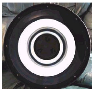
Figura 1: Aspetto degli specchi collimati